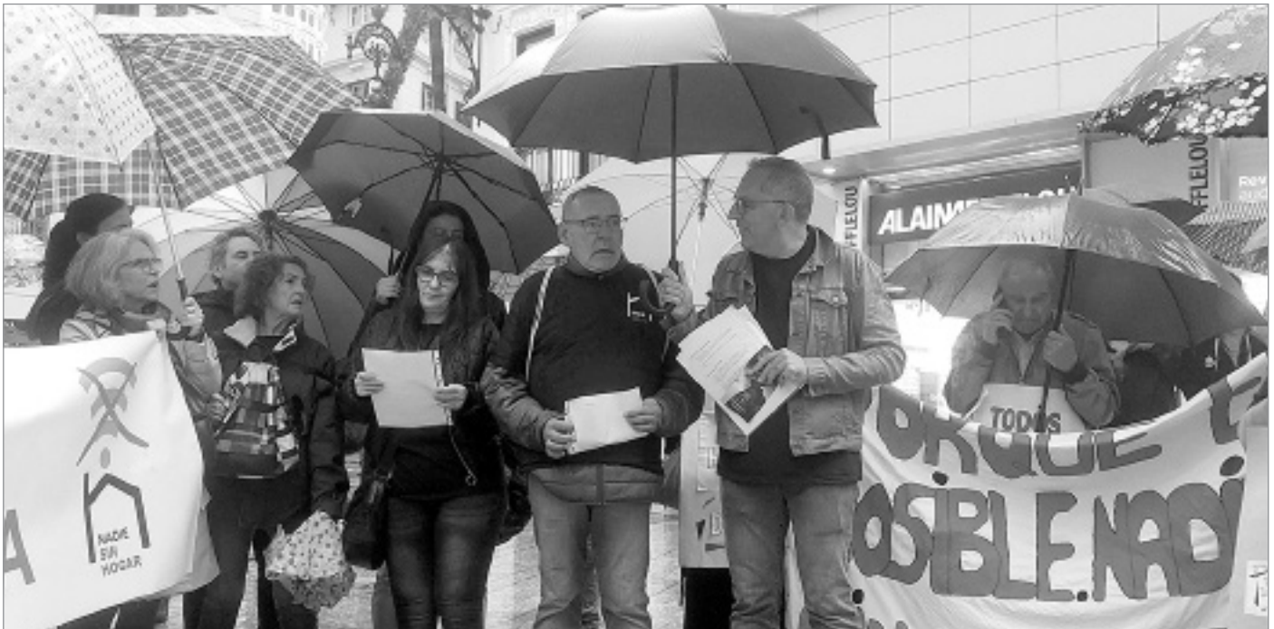
Foto: Acto de sensibilización en la calle con motivo de la celebración del Día de personas sin hogar

Con motivo del Día de las Personas sin hogar, celebrado el domingo 27 de octubre, Cáritas Española lanzó su nueva campaña contra el sinhogarismo, bajo el lema «Caminemos Juntos», una iniciativa con la que se ha querido visibilizar las dificultades a las que se enfrentan estas personas.