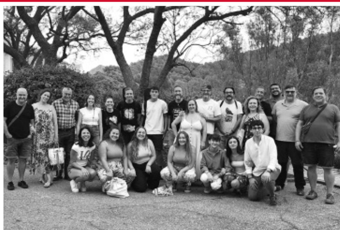
Músicos Católicos Contemporáneos

Recordamos que quienes deseen colaborar como voluntarios en Cáritas, pueden llamar al teléfono 952 28 72 50 o enviar un correo a voluntariado@caritasmalaga.es .