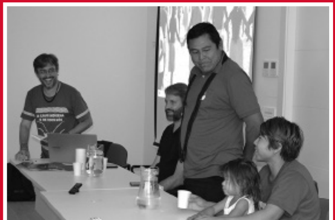
Encuentro con líderes indígenas en los servicios generales