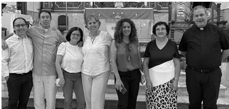
Foto: Grupo de Cáritas Parroquial de Santiago Apóstol, en Casarabonela

Ya durante estos meses de preparación, comenzaron a acercarse a la parroquia personas que conocían de la existencia de este grupo que se estaba creando y recurrían a ellos en busca de ayuda. Porque, «como asegura su párroco, aunque la realidad en los pueblos es muy diferente a la de la ciudad y pueda parecer que no existe necesidad, siempre hay situaciones a las que, como Iglesia, debemos acompañar y ofrecer una respuesta».